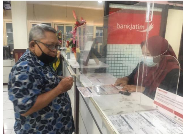
Pelayanan Bank Jatim