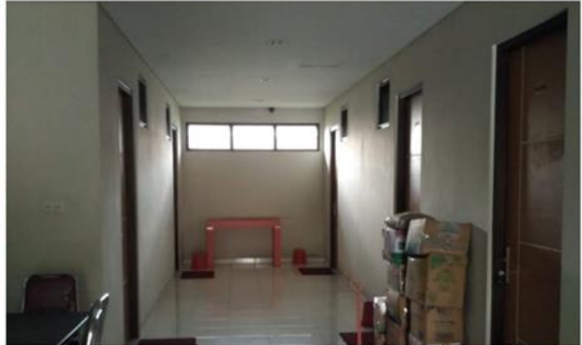
KOS R 15 Jl. Tenggilis Tengah III No. 30 (R15)