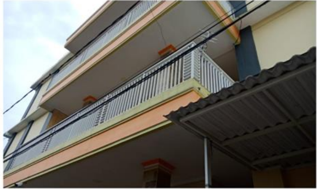
Jl. Keputih Printis II No. 9