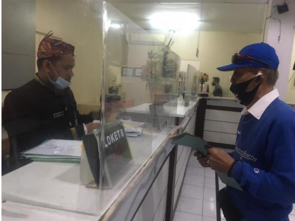
Pelayanan Locket Customer Service