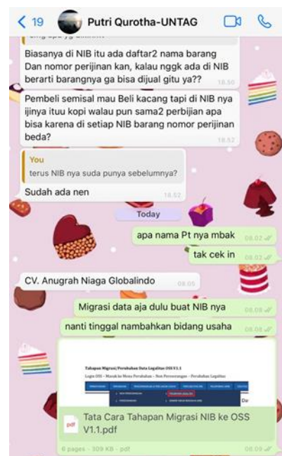
CV Anugrah Niaga Globalindo

Jumlah Perusahaan yang Diberikan Asistensi Online Sebanyak 4 Perusahaan