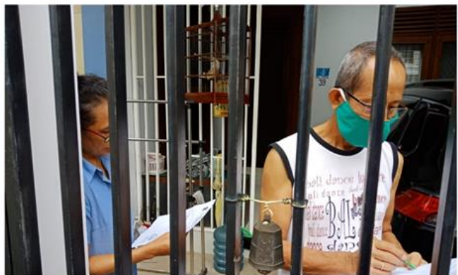
Jl. Bumi Marina Emas Blok E 39