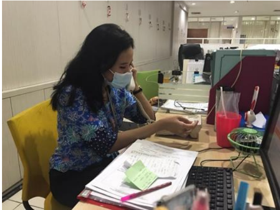
PT Havanna Teguh Pertiwi