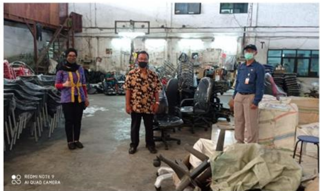
PT KRISTAL INDAH Jl. Margomulyo III / 14 D