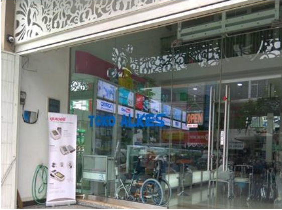
Toko Alkes Buana Husada Lestari Jl. Raya Kapas Krampung No. 196