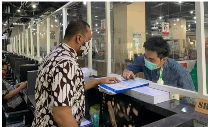
Pelayanan Loker Customer Services

Jumlah Permohonan Perizinan Yang Masuk Sebanyak 75 Berkas