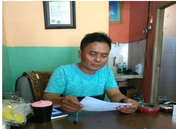
UD Gemilang Motor Jl. Raya Kedung Cowek No. 40