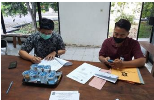
PT Sarana Surya Sakti Jl. Demak Timur No. 2