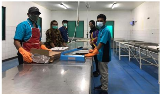
PT SHINMAS JAYA BAHARI Jl Margomulyo 44 Blok H-17