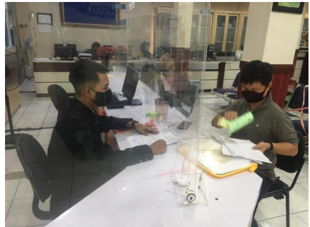
Pelayanan Locket Informasi

Jumlah Permohonan Perizinan Yang Masuk Sebanyak 82 Berkas