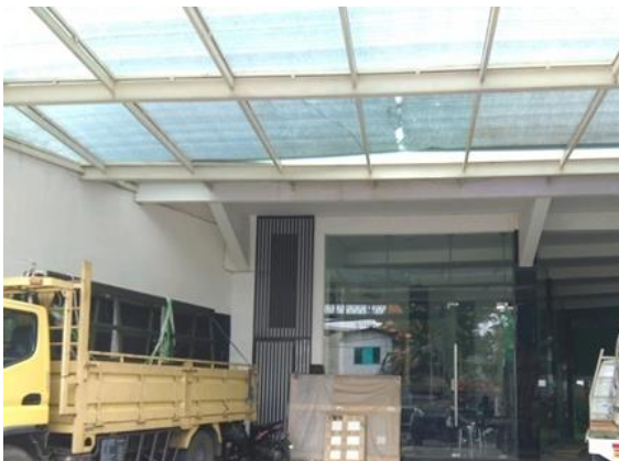
CV Jawi Glass Surabaya Jl. Kapas Krampung 22-24