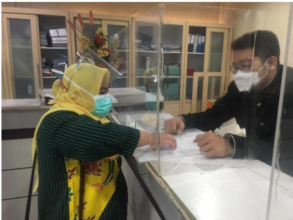
Pelayanan Locket Pengambilan