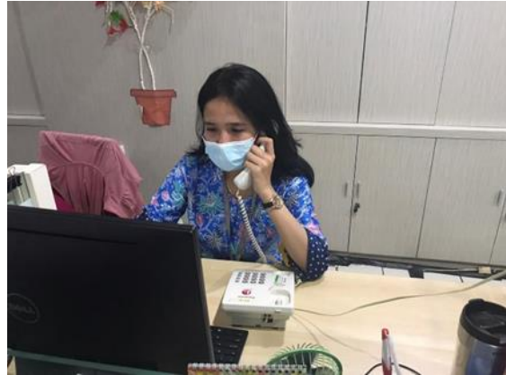
PT Jin Bang Da Technology