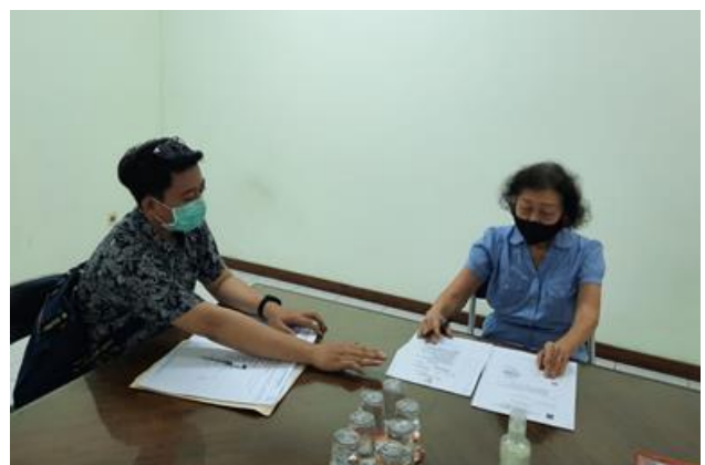
PT NAR stainless Steel Center Jl. Demak Timur No. 7

Jumlah Perusahaan yang Diberikan Survey/Pengawasan Sebanyak 2 Perusahaan