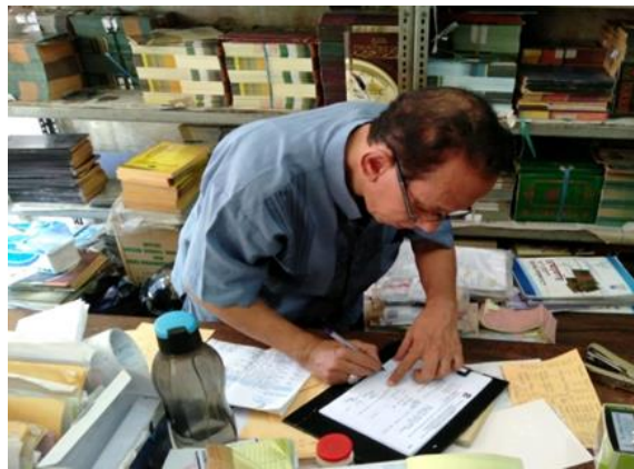
Toko Kitab Ahmad Nabhan Jl. Panggung No. 146