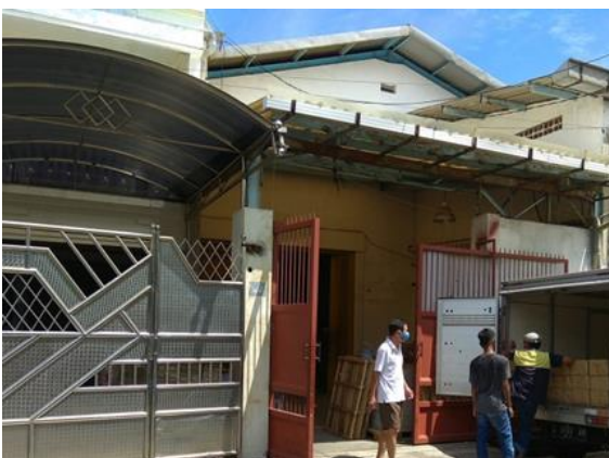
UD Kawan Kita Jl. Karang Asem 16 / 28-30