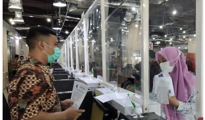
Pelayanan Loker Pengambilan