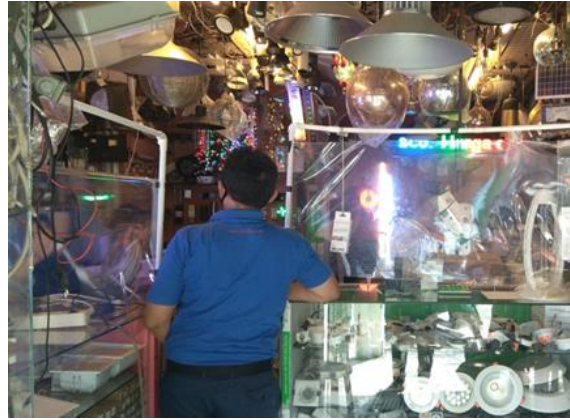
Toko Energy Jl. Jagalan 3-A