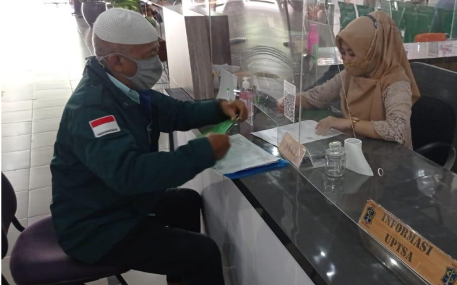
Pelayanan Loker Informasi